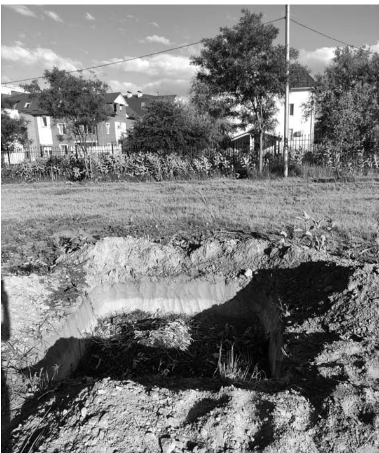
Šioje broliškoje kapo duobėje buvo laikinai palaidoti gatvėje rasti nužudyti civiliai.