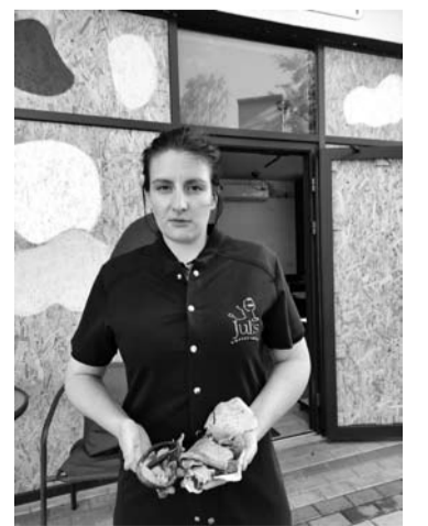
„Jul's“ padavėja Aliona rodo kavinėje rastas skeveldras.

Vėliau jų asmenybės buvo nustatytos ir giminaičiai žuvusiuosius perlaidojo kitur. Ateityje prie šios buvusios broliškos kapavietės ketinama pastatyti simbolinį paminklą, o kol kas neužkasta duobė tarsi simbolizuoja tebesitęsiantį karą ir nepalaujamas ukrainiečių kančias bei netektis.