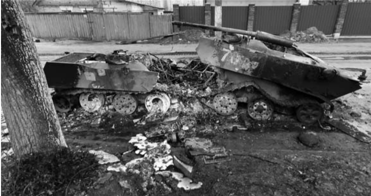
Tai, kas liko iš Rusijos tankų ir sunkiosios artilerijos, kuri trečią karo dieną įvažiavo į Bučą ir buvo sunaikinta.

Maskoliai kelis kartus bandė nutiesti pontoninį tiltą, bet ukrainiečių artilerija jį sunaikino. Įniršę okupantai ėmė patrankomis šaudyti į kitoje upelio pusėje esantį Gustomelį bei Irpinę, o užimtoje Bučioje prievartavo moteris bei mergaites, žudė niekuo dėtus civilius gyventojus.