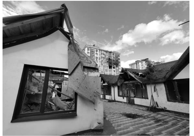
„Contnent“ mikrorajonas Bučioje buvo tapęs maskolių vadaviete ir labai nukentėjo.

Juose vyriškis įkūrė kavinę, draudimo įmonę, turizmo agentūrą, gyvūnėlių maisto bei alkoholio parduotuves ir ketino